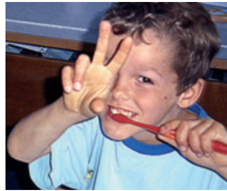
Les enfants doivent apprendre ce qu'il faut faire pour une bonne santé des dents.

L'emploi quotidien de sel fluoré contenant 0,025% de fluorure (p.ex. «JURA SEL») est conseillé pour toutes les pré-