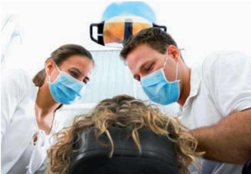
Conçu du point de vue du patient : pour le dossier médical du patient, le médecin-dentiste doit voir le schéma dentaire de la FDI comme dans un miroir.

Dans le schéma dentaire de la FDI, on fait précéder le chiffre de la dent par celui du quadrant. Ainsi, l'incisive centrale droite est désignée par le chiffre 13, la première prémolaire en bas à gauche par le chiffre 34, etc. Comme il s'agit d'une désignation à l'aide de deux chiffres différents, et non d'un nombre à deux chiffres, on dira toutefois 'un-trois', ou 'trois-quatre', et non 'treize' ou 'trente-quatre'. Les quadrants des dents de lait sont numérotés de 5 à 8, de sorte que l'incisive latérale en haut à gauche sera numérotée 62, la deuxième prémolaire en bas à droite 85, etc. Si votre médecin dentiste, lors de votre prochaine consultation, parle de la 'un-sept', vous saurez désormais qu'il s'agit de votre deuxième molaire en haut à droite!