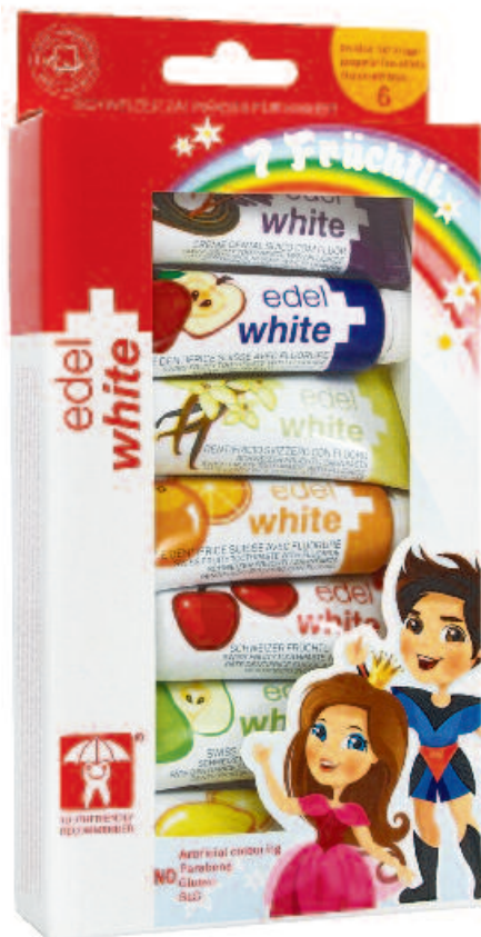
Certifié par Action Sympadent : le dentifrice « Edel+White, 7 Früchtli ».

Avant de distinguer des chewing-gums et bonbons sans danger pour les dents, le logo du « Bonhomme Quenotte » de l'Action Sympadent a d'abord servi d'identifiant à un dentifrice pour enfants. Le dentifrice « Edel+White 7 Früchtli » contient du fluorure biodisponible qui contribue significativement à éviter la formation de caries.