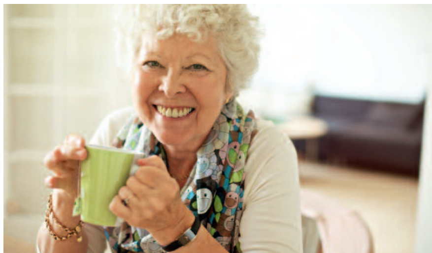
Durant l'hiver, du thé, sans sucre, fait aussi du bien à votre bouche.

Les seniors sont nombreux à souffrir de sécheresse buccale qui menace la santé des dents. En effet, la salive protège les dents : son action est antibactérienne et elle neutralise les acides.